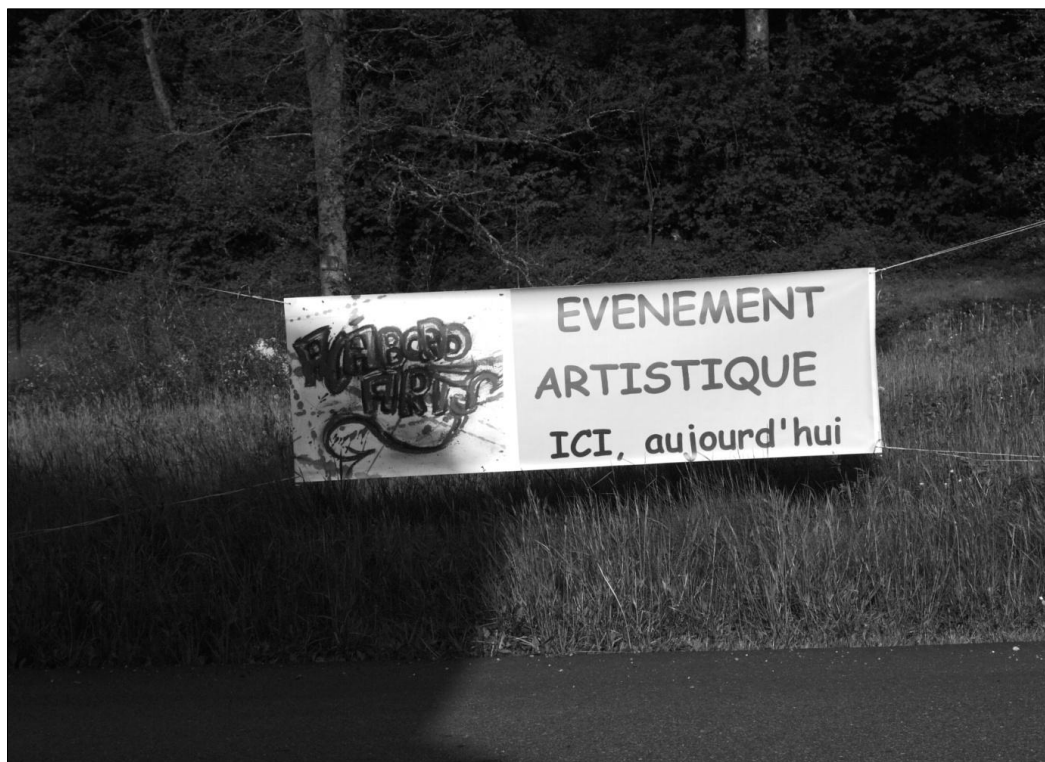
Ateliers Ouverts en Alsace, Bourg-Bruche.